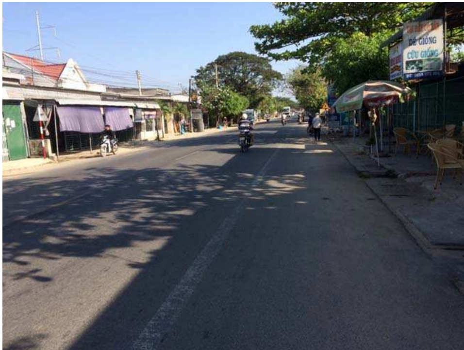
Sur la Nationale 27. Nous sommes à 60 km de Dalat

Dans de nombreux endroits, les portions de plage sont occupées par des restaurants, en d'autres, des investisseurs, souvent chinois, ont acheté de grandes parcelles pour en faire des resorts, pour le moment pratiquement déserts. Mais tout cela a pour conséquence : les habitants des environs n'ont plus d'accès à la plage.