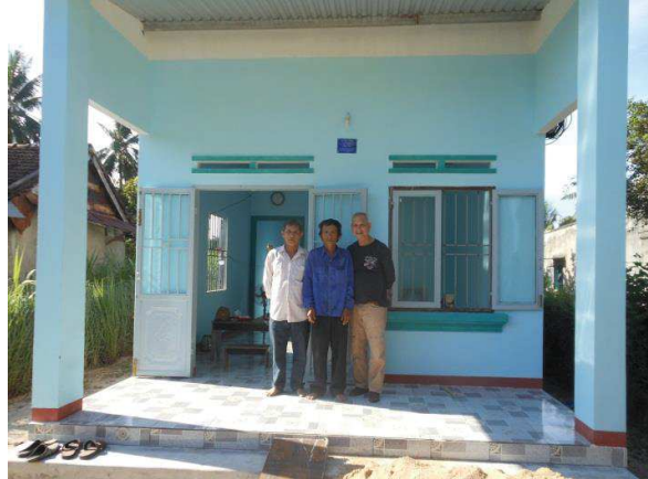
Áp Xuân Lập, Xã Cam Tân, Huyện Cam Lâm, Khánh Hoà