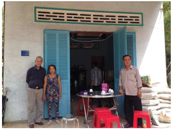
Ấp Hoà Thới, Xã Hoà Định, Huyện Chợ Gạo, Tiền Giang