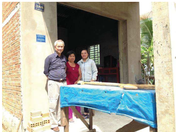
Ấp Bình Long, Xã Song Bình, Huyện Chợ Gạo, Tiền Giang