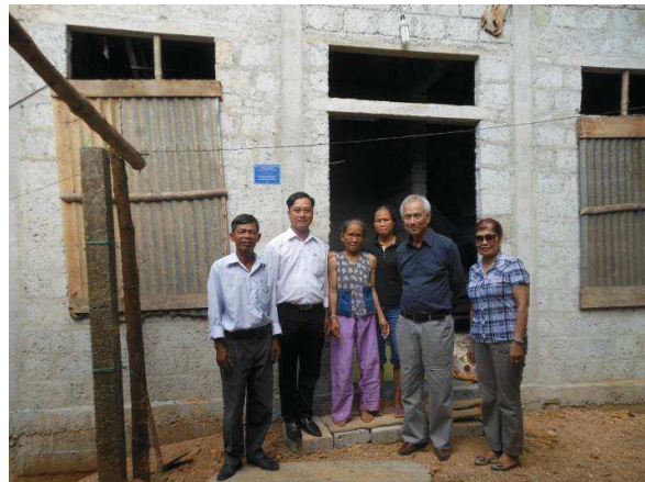
Thôn La Khê Bãi, Xã Hương Thọ, Huyện Hương Trà, Huế