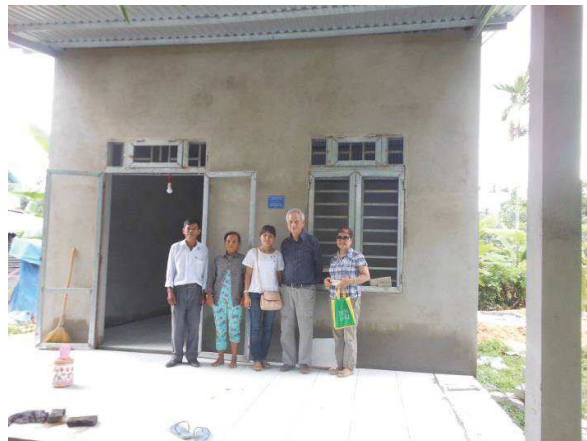
Thôn Đình Môn, Xã Hương Thọ, Huyện Hương Trà, Huế