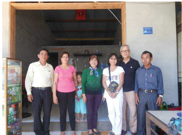
15 kiệt 112, đường Đặng Huy Trứ, Phường Trường An, Huế