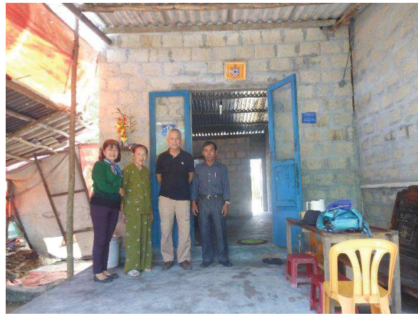
19 kiệt 112, đường Đặng Huy Trứ, Phường Trường An, Huế