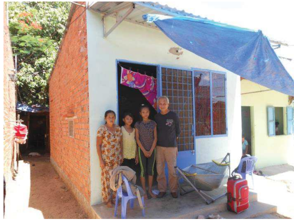
Tổ 18, Khu phố 7, Phường Đức Long, Phan Thiết