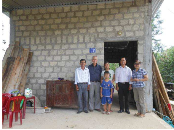
Thôn Liên Bằng, Xã Hương Thọ, Huyện Hương Trà, Huế