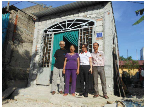
Tổ 5, Khu vực 2, Phường An Hòa, Huế