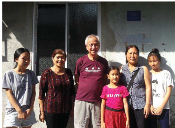
13 kiệt 112, đường Đặng Huy Trứ, Phường Trường An, Huế