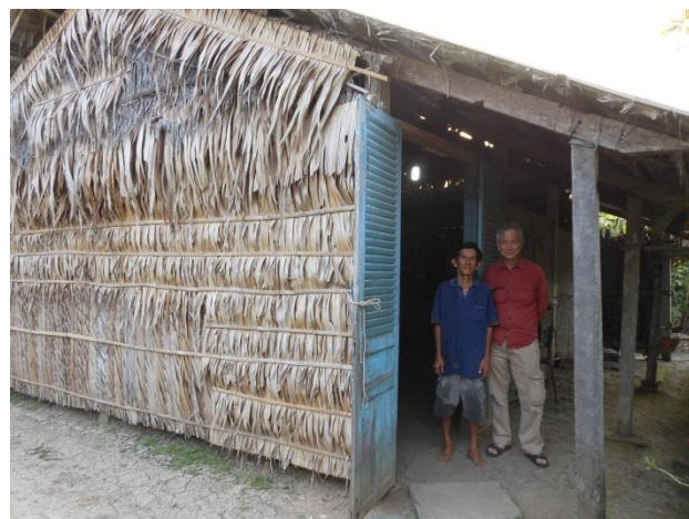
3 Nguyễn Tự Phong Vân Phường 8, TP Mỹ Tho