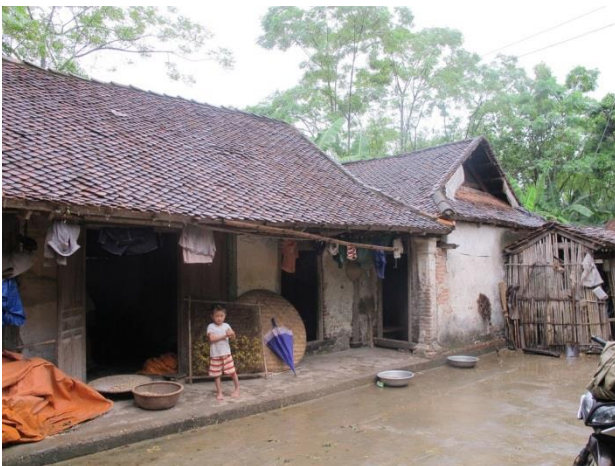
13 Đặng Duy Long