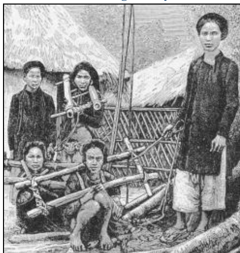
Malfaiteurs sous la cangue, avec leur gardien