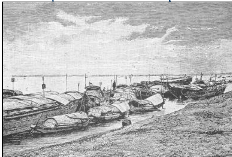
Sampans et jonques sur une rive du Fleuve Rouge