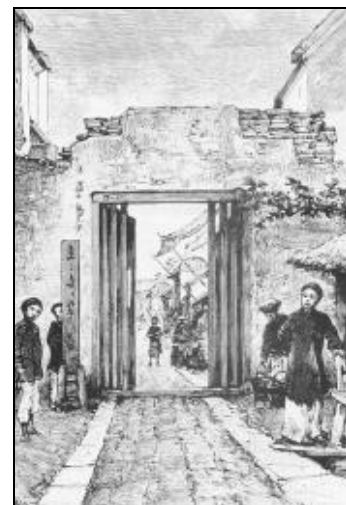
Porte d'un quartier de Hà Nội