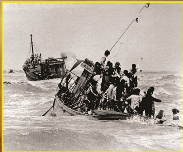
Boat people en 1981