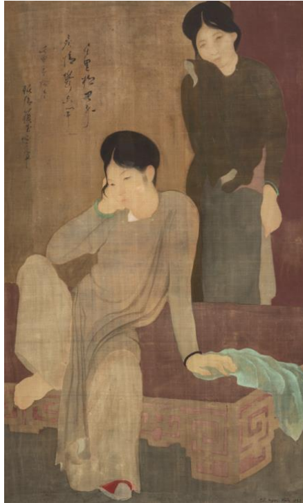
"Les désabusées" de Tô Ngọc Vân

Au cours de la même vente à Hongkong, un tableau de Tô Ngọc Vân intitulé "Les Désabusées" a été vendu pour 1,1 million de dollars. Tô Ngọc Vân (1906-1954) faisait partie de la 2 e promotion de la même École des Beaux-Arts en 1931.