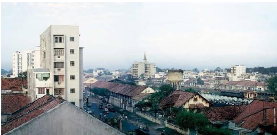
13. Đường Phạm Ngũ Lão năm 1969 – 1970