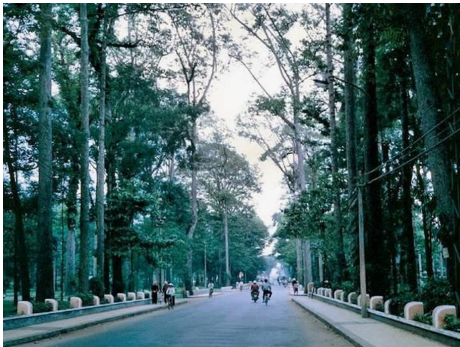
2. Đường Trương Công Định (nay là đường Trương Định) chạy băng qua công viên Tao Đàn. Ảnh chụp năm 1976.