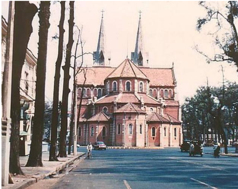
7. Khu vực nhà thờ Đức Bà rợp bóng cây xanh