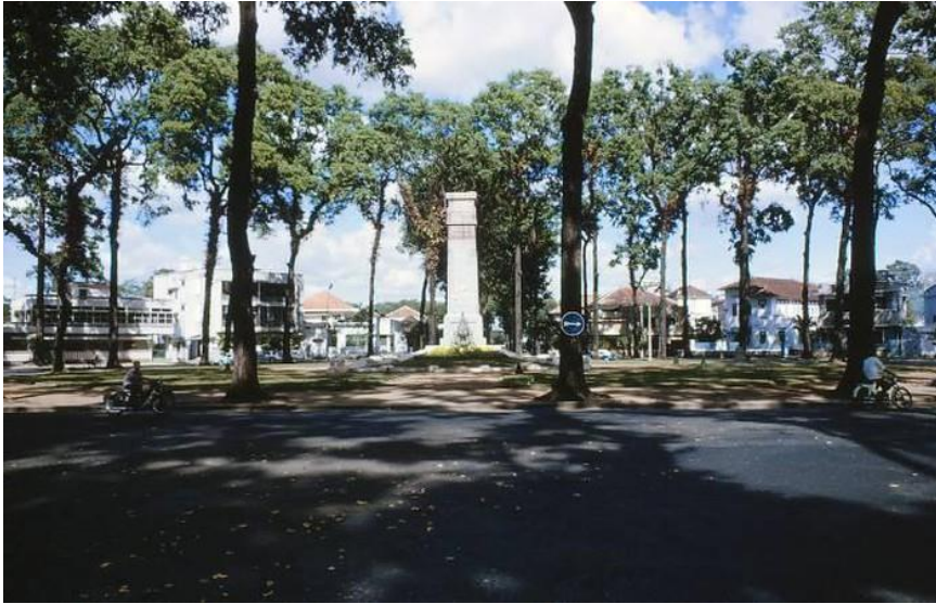
6. Công trường Chiến sĩ nhìn từ đường Trần Quý Cáp (Nay là Võ Văn Tần), bên phải là ra Nhà thờ Đức Bà. Ảnh: Iparkes chụp năm 1964