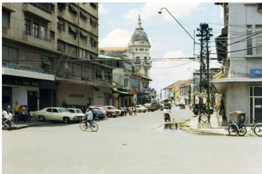
12. Đường Ngô Đức Kế năm 1972