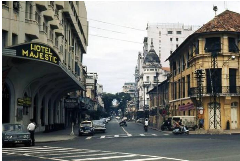
8. Từ sông Sài Gòn nhìn về phía đường Tự Do (nay là Đồng Khởi)