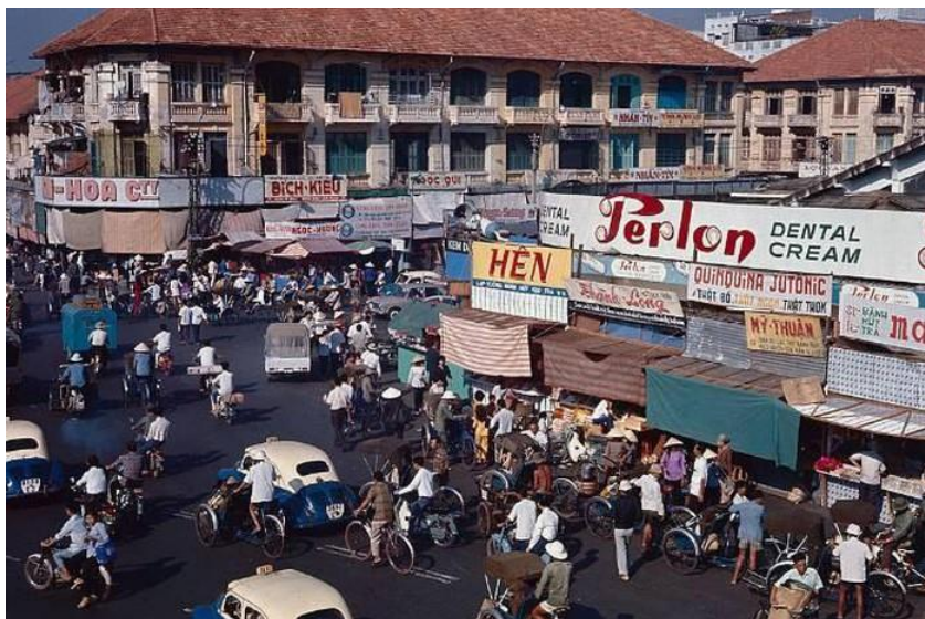
11. Chợ Saigon Xuân Canh Tuất 1970