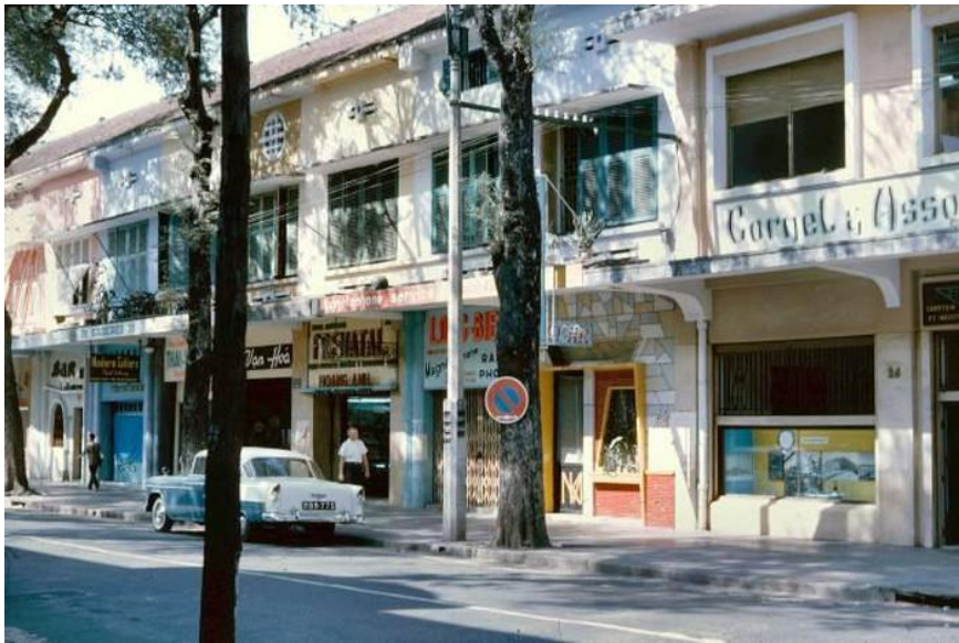
3. Đường Tự Do năm 1965