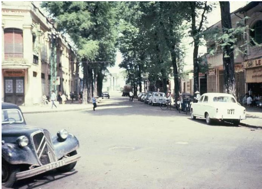
10. Đường Phan Văn Đạt năm 1965 – 1966