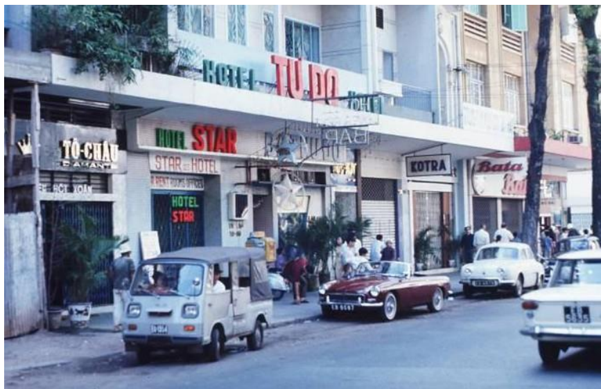
4. Đường Tự Do chụp năm 1969, gần góc Tự Do – Nguyễn Thiệp.