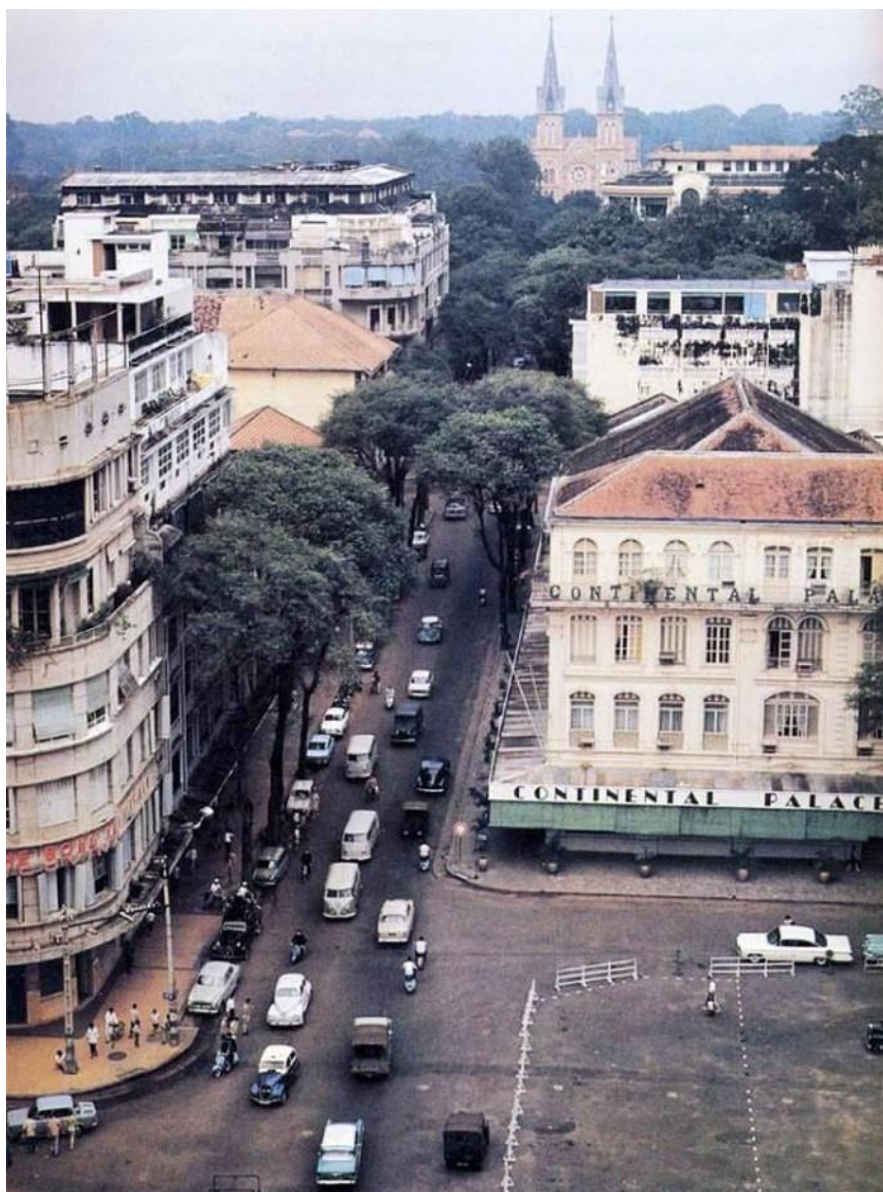
9. Đường Tự Do (nay là đường Đồng Khởi) với khách sạn Continental