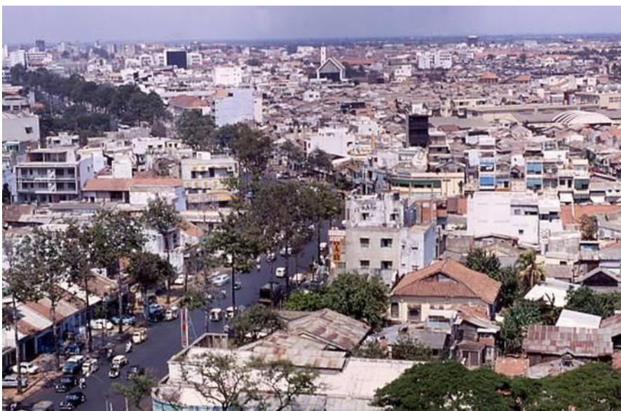
14. Đường Trần Hưng Đạo năm 1969