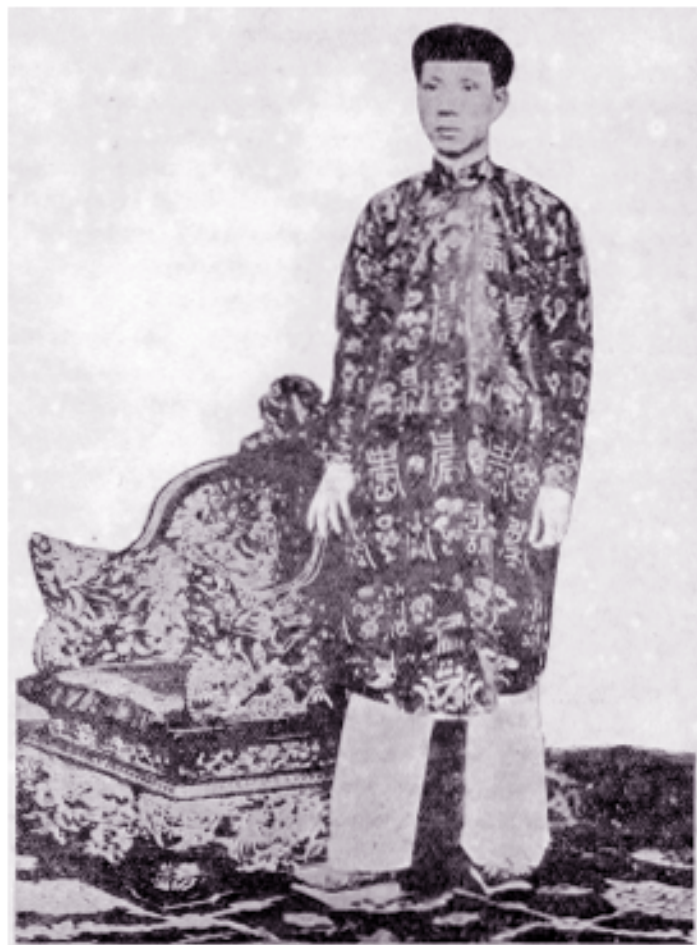
Planche II. — L'Empereur Khải-Định en costume de ville. (Photographie publiée avec la gracieuse autorisation de Sa Majesté).