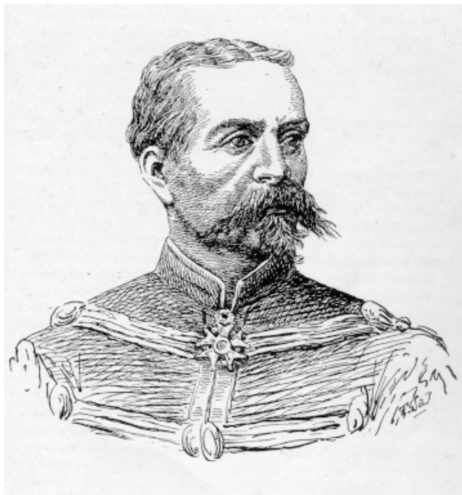
Planche VIII. — Le Générale de COURCY. (Copie, par M. Tôn -Thát Sa, d'un dessin de H. MEYER, publié dans « La Guerre du Tonkin », p. 785).