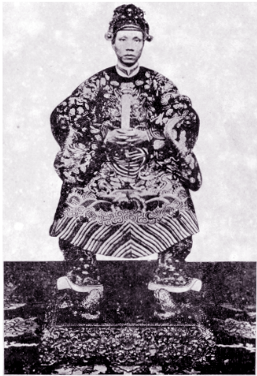
Planche I. — L'Empereur Khải-Định en costume de cour.