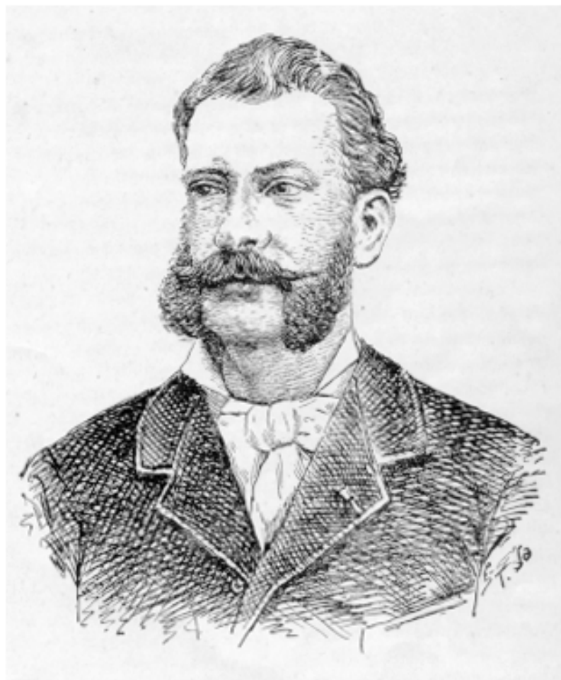
Planche IV. — M. PALASNE DE CHAMPEAUX. (Copie, par M. Tôn -Thát Sa, d'un dessin publié dans « La Guerre du Tonkin », p. 128).