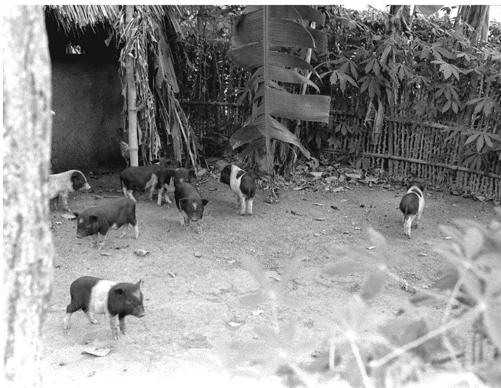
Chuồng lợn. Việt Nam. 1982.

-Thưa cụ, con này chúng con đã vỗ, ăn toàn bột đao ; chắc sắp ngã được !