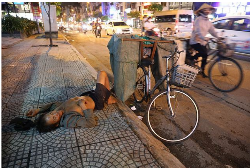
Người vô gia cư ngủ tạm trên vỉa hè đường Hoàng Diệu, Q.4