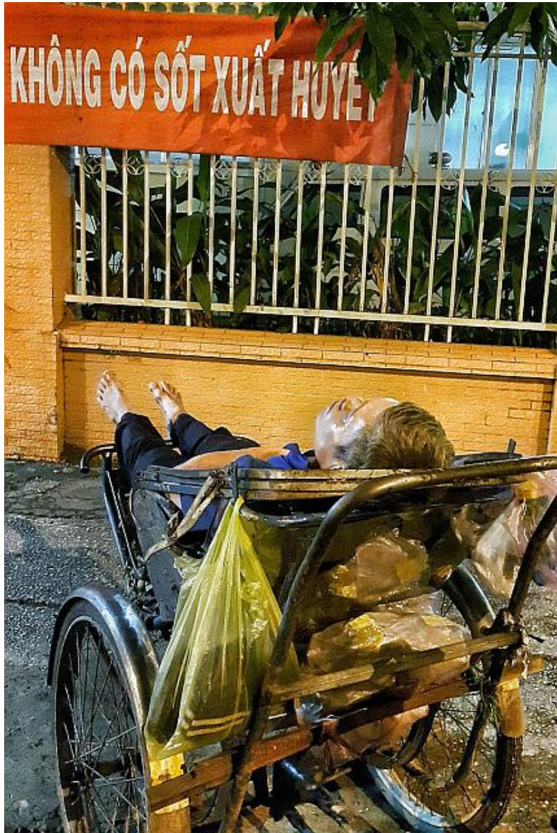
Ngủ ngoài trời thường xuyên, những người vô gia cư đối mặt với nguy cơ mắc bệnh