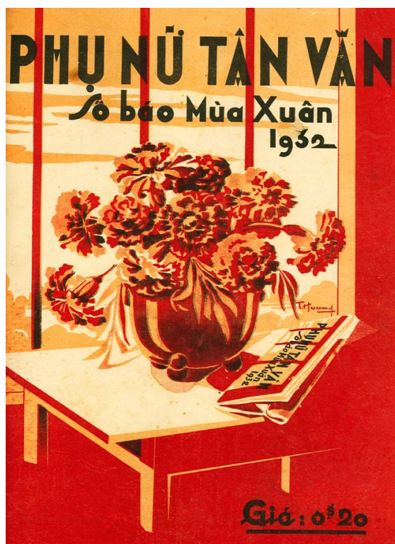
Bìa báo xuân Phụ Nữ Tân Văn các năm 1932

Phụ Nữ Tân Văn Tết 1930 là một trong những tờ báo xuân phát hành sớm nhất ở miền Nam mà chúng tôi xem được đầy đủ. Trang đầu tờ báo ghi rõ “Số báo mùa xuân 1930”.