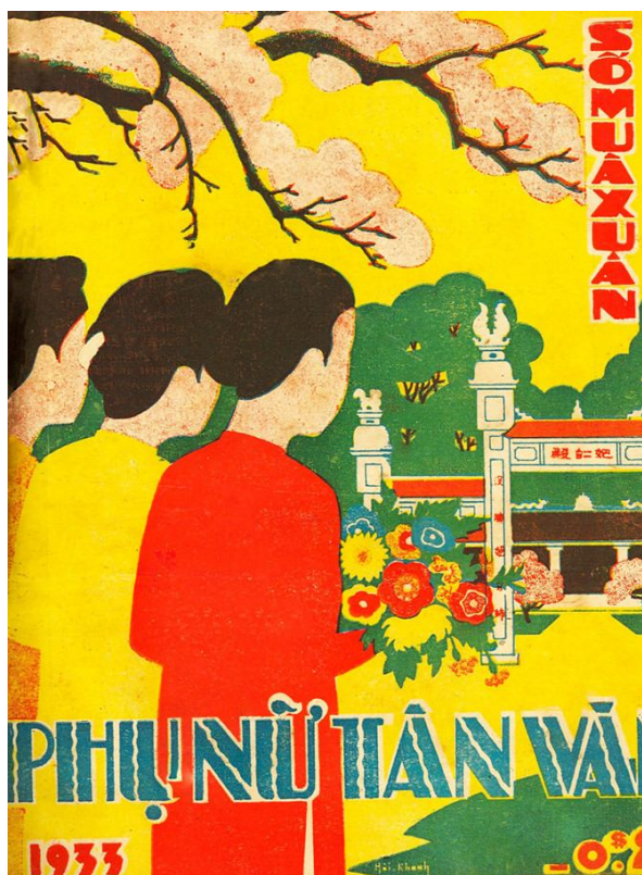
Bìa báo xuân Phụ Nữ Tân Văn các năm 1933

Đọc lại 4 tờ báo xuân Phụ Nữ Tân Văn năm 1930, 1932, 1933 và 1934, ta thấy có điều đáng lưu ý là không tờ báo xuân nào nhắc đến năm âm lịch của tết đó, không chỉ trên bìa báo, mà toàn bộ bài vở bên trong. Chi tiết tuy nhỏ nhưng thể hiện chủ trương canh tân mà báo nhắm tới.