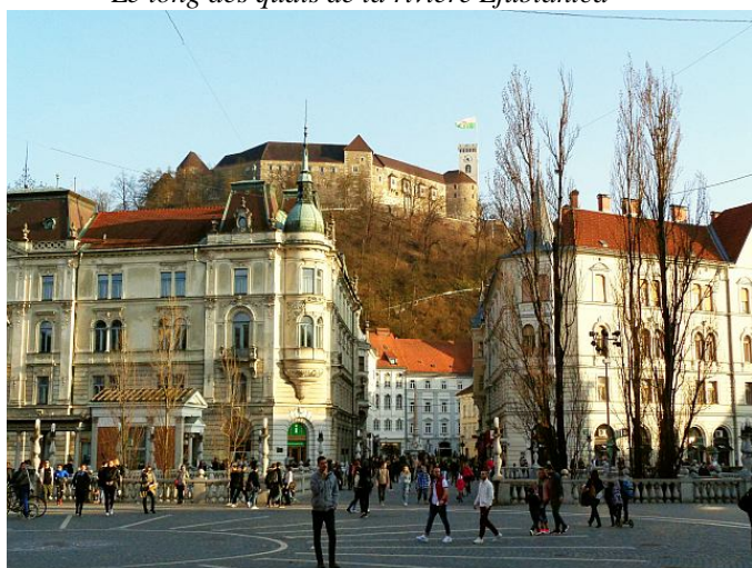
Vue du château à partir du Triple Pont