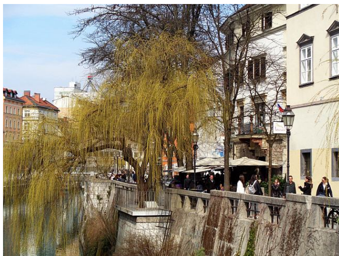
Le long des quais de la rivière Ljubljanica

Cerise sur le gâteau, tout le monde y parle anglais (furieusement courant depuis l'indépendance) et comprend bien l'italien – la minorité italienne sur la côte est représentée au Parlement – avec une survivance visible de l'allemand et une résistance du français (l'Institut Français y est pour quelque chose). Et la notion de bon service en découle, rien de tel que de déjeuner ou dîner pour le constater. A cet égard, fréquenter les lieux de bouche donne une vision contrastée : ici des auberges ou des plats parfaitement italiens, là des fromages, charcuterie et viandes carrément Europe Centrale, le tout servi régulièrement avec le sourire, chose devenue rare à Berlin, Paris ou Amsterdam. L'hôtellerie à Ljubljana a gardé de son passé yougoslave une place robuste car « presque » ouest-européenne : très développée partout, à des prix encore bien raisonnables pour les parisiens ou les berlinois.