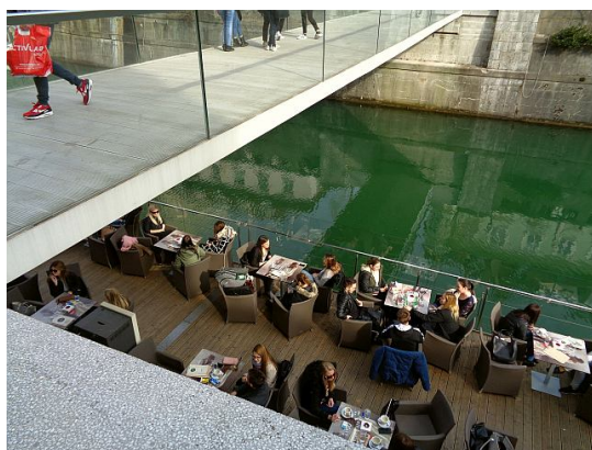
Café sur les quais inférieurs, Ljubljana