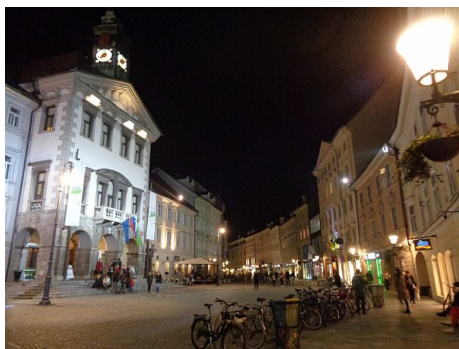
La Vieille Ville la nuit, avec la mairie