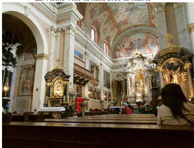
Intérieur style baroque de l'Eglise Franciscaine

Quitter Ljubljana pour visiter le pays est fort facile : en voiture les routes/autoroutes sont d'une modernité et d'une qualité étonnantes, sinon le réseau autochtone d'autocars inter-villes est préférable car très dense et ponctuel (la Suisse, vous dis-je ...), pour aller du côté de Piran et Portoroz à 110 kms de Ljubljana sur la côte méditerranéenne, face à Venise en Italie. Pour 12 euros en moins de 2 heures. Eh oui, la Slovénie a environ une quarantaine de kilomètres de côtes marines coincées entre l'Italie au nord et la Croatie au sud. Piran, pointe de terre dans l'Adriatique, a un centre-ville de style vénitien. Cette localité ainsi que sa voisine Portoroz (un petit St Tropez local) à quelques kilomètres de là méritent que vous y passiez une journée quitte à sommeiller dans l'autocar au retour