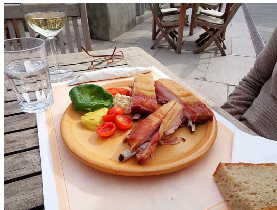
Plat régional slovène