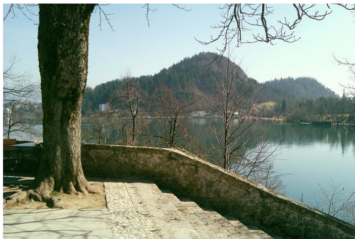
Vue sur le lac de Bled, à partir de son île centrale