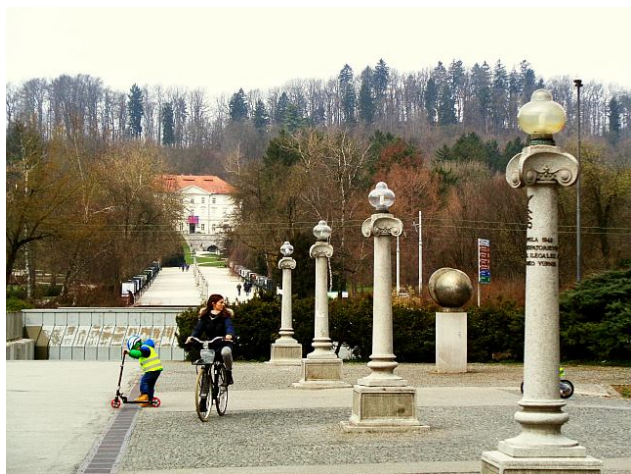
Le parc Tivoli à Ljubljana