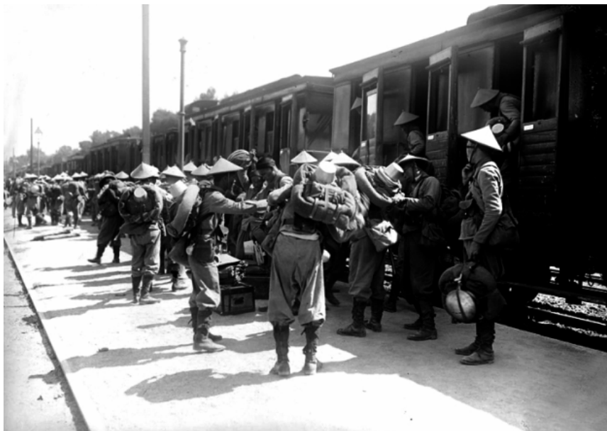
Những người lính An Nam xuống ga đầu mối Saint Raphael. Tàu hỏa thời bấy giờ khá sang trọng, mỗi toa được chia thành nhiều khoang có cửa lên xuống riêng.

Saint Raphael là một thị trấn ven bờ Địa Trung Hải, thuộc tỉnh Var trong vùng Provence-Alpes-Côte d'Azur ở phía đông nam nước Pháp. Thời kì thế chiến thứ nhất nơi đây được coi là một tổng kho tiếp vận với ga xe lửa đầu mối, đường ô tô. Nó cũng là một quân trường khổng lồ với những trại lính dưới chân núi. Với sự thuận lợi về khí hậu của vùng đất có đường bờ biển dài 36 km, Saint Raphael ngày nay trở thành một khu nghỉ mát nổi tiếng. Dưới đây là loạt ảnh những người lính Việt tại Tổng trạm Saint Raphael, chụp năm 1916, lúc Thế chiến thứ nhất đang vào hồi quyết liệt. Chú thích ảnh theo bình luận của những người lính diễn đàn Dựng nước - Giữ nước