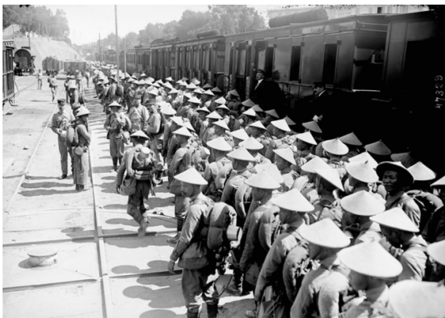
Quân trang, quân phục tươm tăt: ghê-t da, áo bông ngoài quần, thắt lưng, ba lô vuông với chiếc nôi cá nhân, +dùng thay bát. Thứ lạ lẫm nhất đối với mấy nhân viên hỏa xa có lẽ là chiếc nón chóp của những người lính.