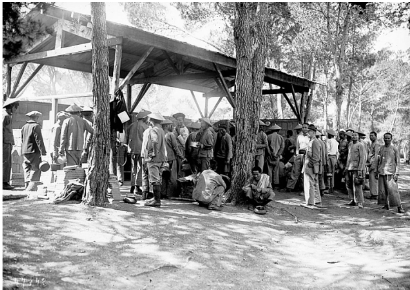
Mỗi người nhận khẩu phần ăn của mình vào một chiếc xoong nhỏ rồi tùy nghi tìm chỗ đánh chén. Quang cảnh khu vực bếp ăn khá ồn ào. Có thể phân biệt được những người lính và cấp chỉ huy thông qua quân phục (tham khảo phụ ảnh cuối bài)