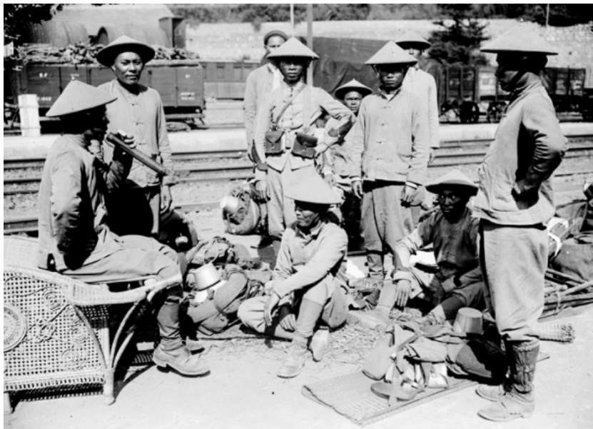
Nghỉ giải lao trên đường ke nhà ga Saint Raphael. Chiếc điều cày mang theo từ quê nhà cho phỏng đoán người lính này đến từ một miền quê Bắc Bộ.