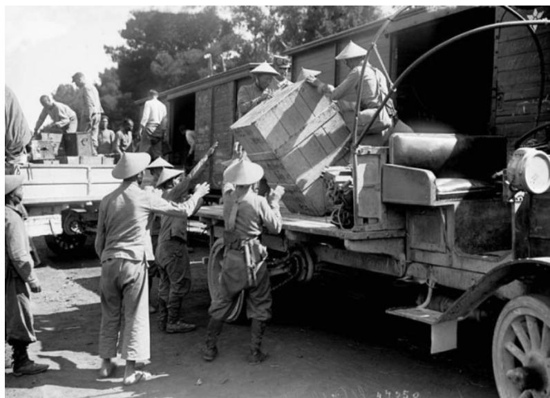
Những người lính bốc dỡ hàng từ các toa tàu xuống xe tải. Trời nóng một lính bỏ ghệt cho thoáng chân.