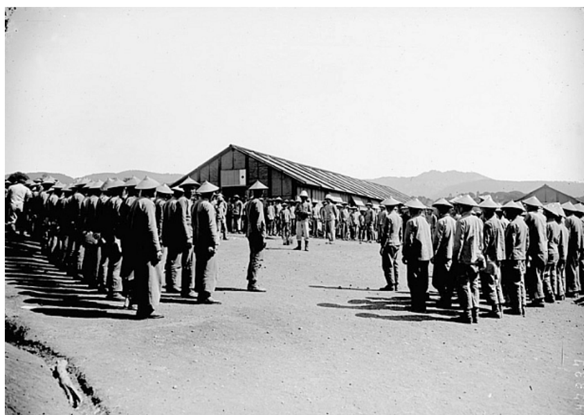
Ngày đầu ở trung tâm huấn luyện. Những người lính tập trung nghe cấp chỉ huy phổ biến kỷ luật đơn vị. Những dãy núi xa mờ kia, chiều chiều những người lính hẳn vẫn hoài vọng nhớ thương về cố quốc.