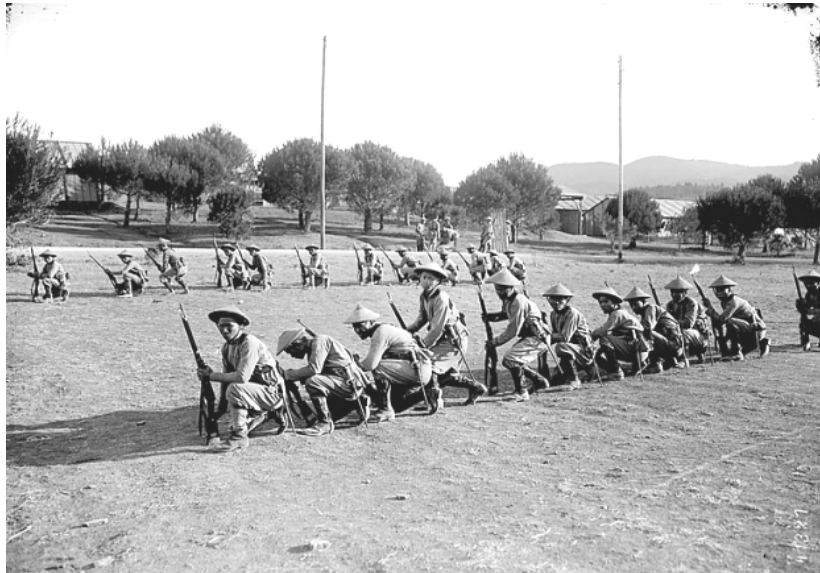
Sau khi thuần thực, chuyển sang học chiến thuật bộ binh.