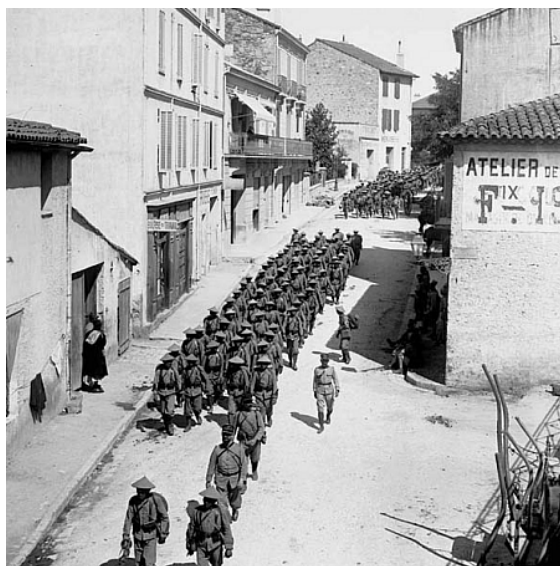
Đơn vị lính mới đến hành quân về quân trường. Dân địa phương ra xem.