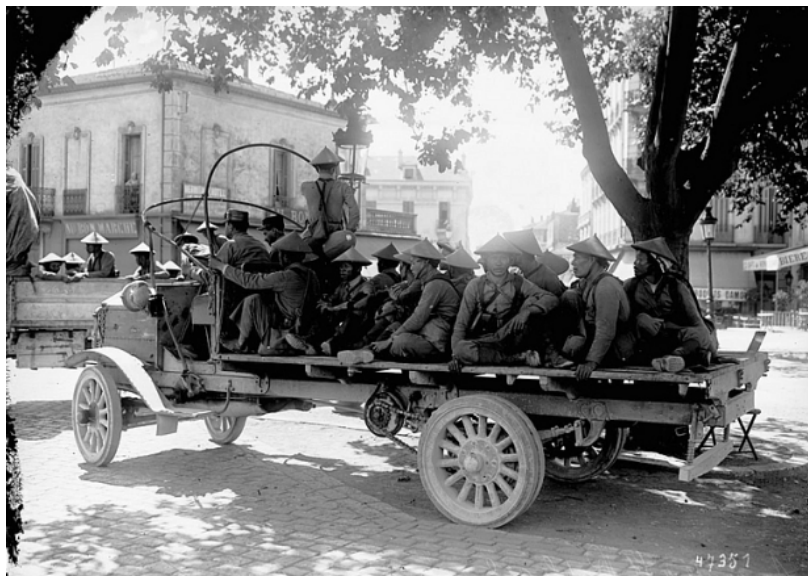
Họ băng qua thị trấn quân vụ