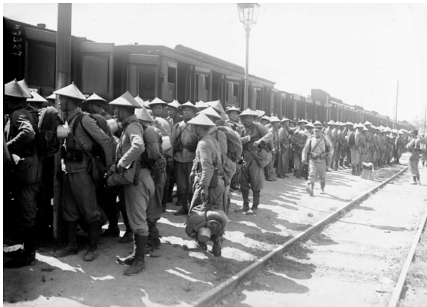
Hình thể những người lính Việt khá to cao và đồng đều, chứng tỏ họ được tuyển lựa khá kỹ càng.