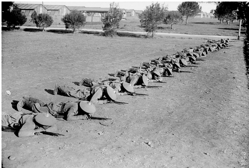
Vận động dưới làn hỏa lực súng máy.