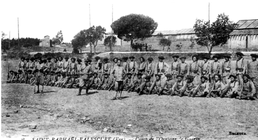
2 SAINT-RAPHAËL-VALESCURE (Var). — Camp de l'Oratoire de Guérin. Tirailleurs Tonkinois à l'exercice. — Li.