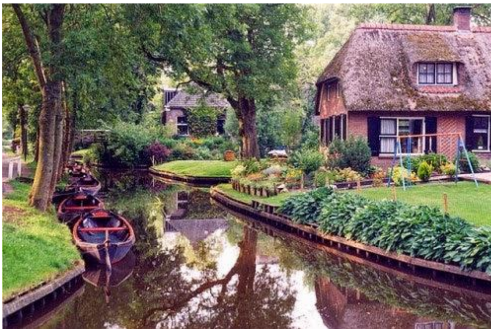
Làng Giethoorn ở Hà Lan

Ngôi làng nhỏ ở tỉnh Overijssel, Hà Lan này được mệnh danh là Venice của Hà Lan với khoảng 7,5 km kênh đào chạy khắp làng