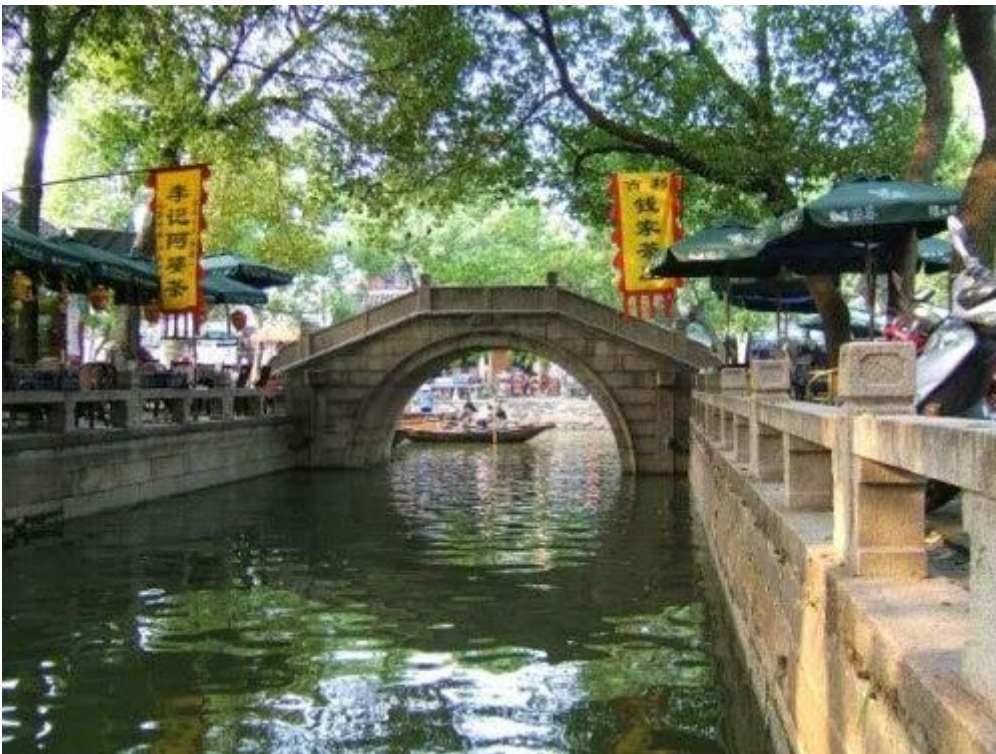
Tongli, Trung Quốc

Tongli là một thị trấn ở thị xã Ngô Giang, Trung Quốc. Những kênh đào tuyệt đẹp cùng những cây cầu nổi tiếng mang đậm dấu tích lịch sử biến Tongli thành một địa danh nổi tiếng của Trung Quốc.