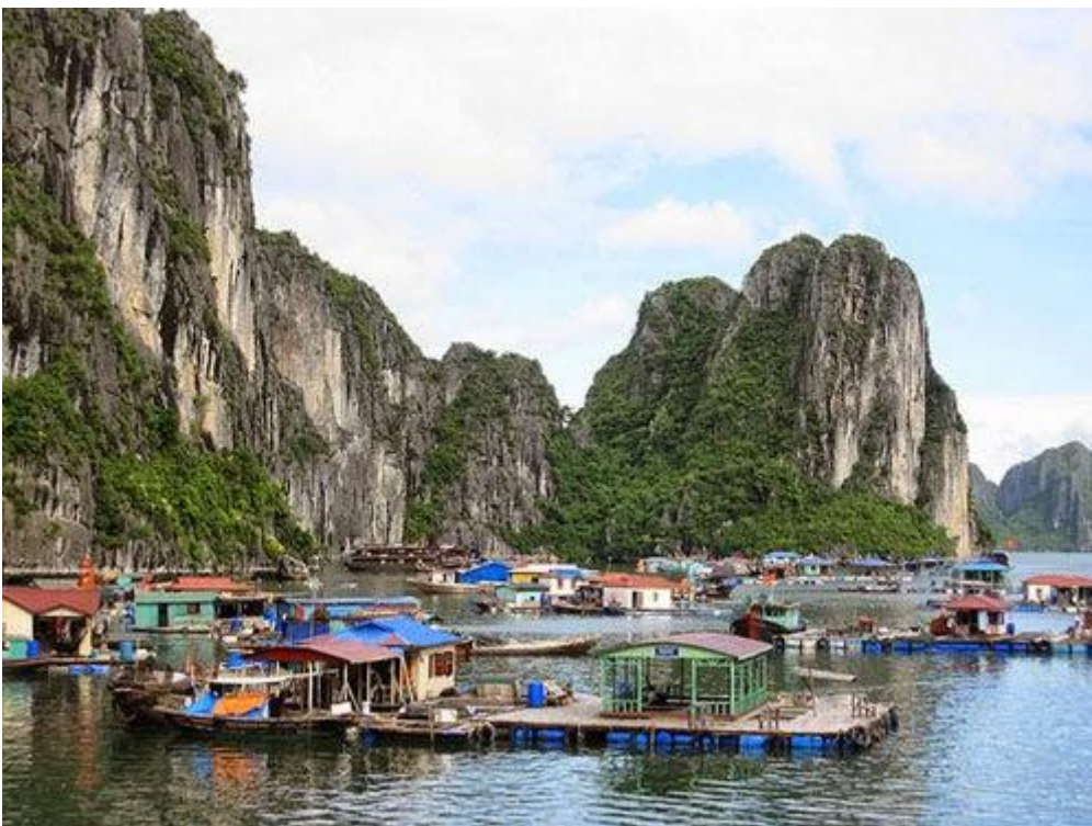
Làng chài ở vịnh Hạ Long

Các ngư dân thường đi đánh bắt cá vào sáng sớm và bán thành quả của mình cho những con thuyền lớn chuyên chở cá tươi đến các khu chợ trong lục địa.