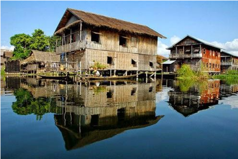
Làng Kay Lar Ywa, Myanmar

Kay Lar Ywa là một ngôi làng nổi nằm trên hồ Inle. Dân cư ở đây chủ yếu là người Intha, sinh tồn nhờ những trang trại trồng rau. Người Intha sử dụng loại sậy trong hồ để tạo ra những khu vườn nổi và cố định chúng bằng những thân tre cắm xuống lòng hồ. Người dân thường trồng cà chua và đậu trên các “thửa đất” này.