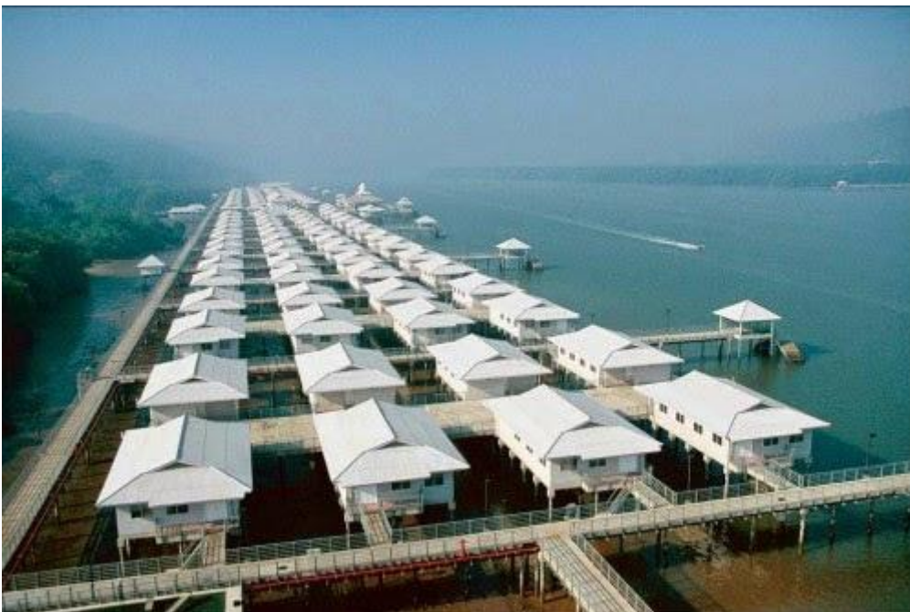
Làng nổi Kampong Ayer, Brunei

Người ta đã bắt đầu sinh sống ở ngôi làng này từ hơn 1300 năm trước. Một số nhà còn trồng cả cây và nuôi gà.