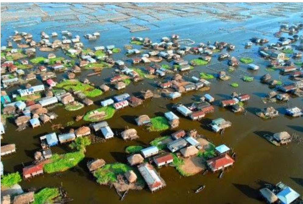
Làng Ganvie, Benin

Ngoài du lịch, người dân trong làng còn sinh sống bằng nghề đánh bắt và nuôi trồng hải sản.