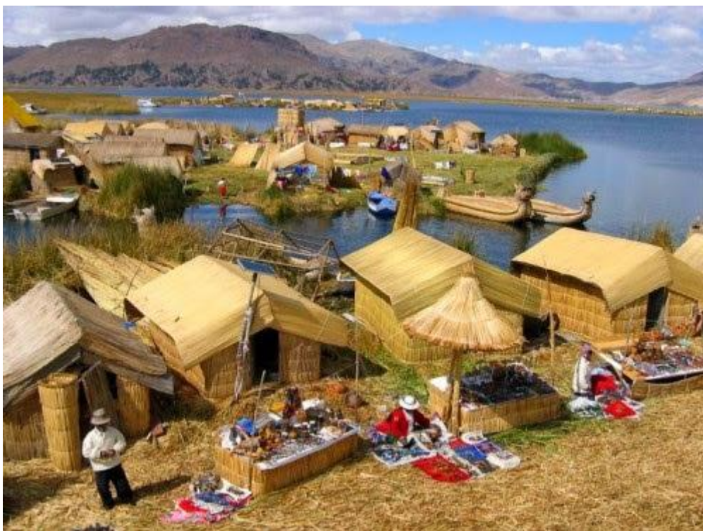
Làng nổi Uro, Peru

Người Uro sống trên các “đảo tự tạo” trên hồ Titicaca, Peru. Những “hòn đảo” được người dân làm ra từ loại sậy mọc rất nhiều trong các hồ cạn. Các đảo tự tạo này trôi nổi trên mặt nước và thường bị dòng thủy triều tràn vào. Vì vậy, cứ nửa tháng, người ta phải lót lại lớp sậy mới.