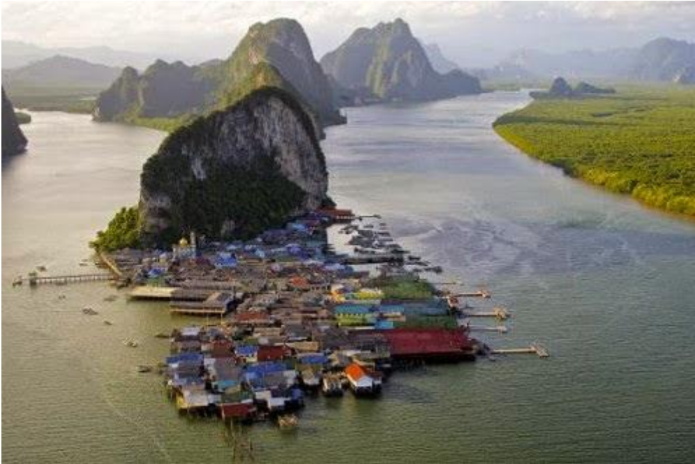
Làng Ko Panyi, Thái Lan

Đặc biệt, ngôi làng còn có hẳn một sân bóng đá. Bắt đầu từ mùa World Cup 1986, cư dân trong làng đã xây dựng sân bóng từ những mảnh gỗ và bè đánh cá cũ để làm chỗ vui chơi cho lũ trẻ.