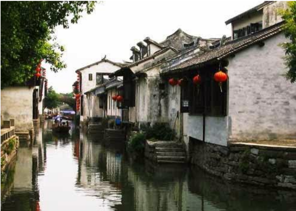
Thị trấn Chu Trang, Trung Quốc

Chu Trang nằm cách thành phố Tô Châu 30 km về phía đông nam, là một trong số những thị trấn nổi tiếng nhất Trung Quốc. Vẻ đẹp của thành phố này khiến bất kỳ du khách nào ghé thăm cũng phải mê mẩn.