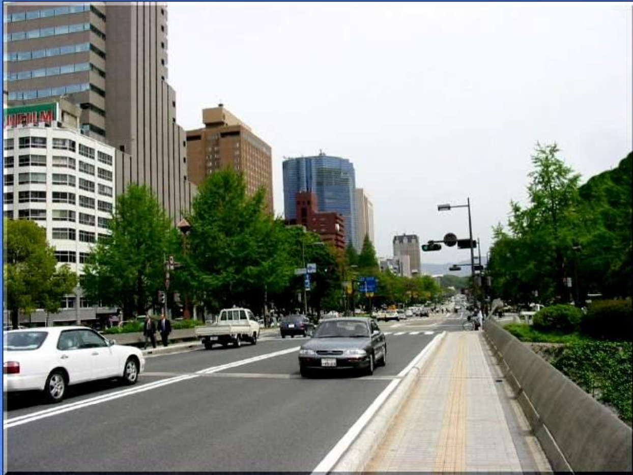
Avenue de la Paix – Hiroshima - 2004