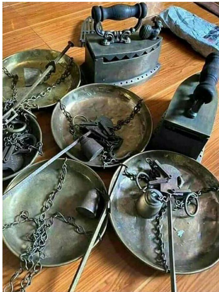
Bàn ủi than, cân xách tay 2 món đồ này của người Miền Nam VN giờ đã mai một