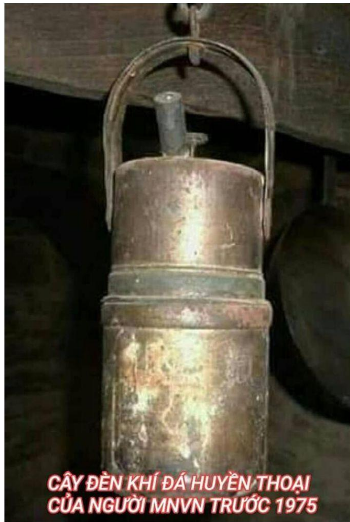
CÂY ĐÈN KHÍ ĐÁ HUYỀN THOẠI CỦA NGƯỜI MNVN TRƯỚC 1975