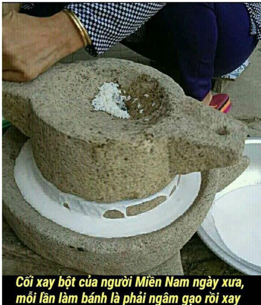
Cối xay bột của người Miền Nam ngày xưa, mỗi lần làm bánh là phải ngâm gạo rồi xay