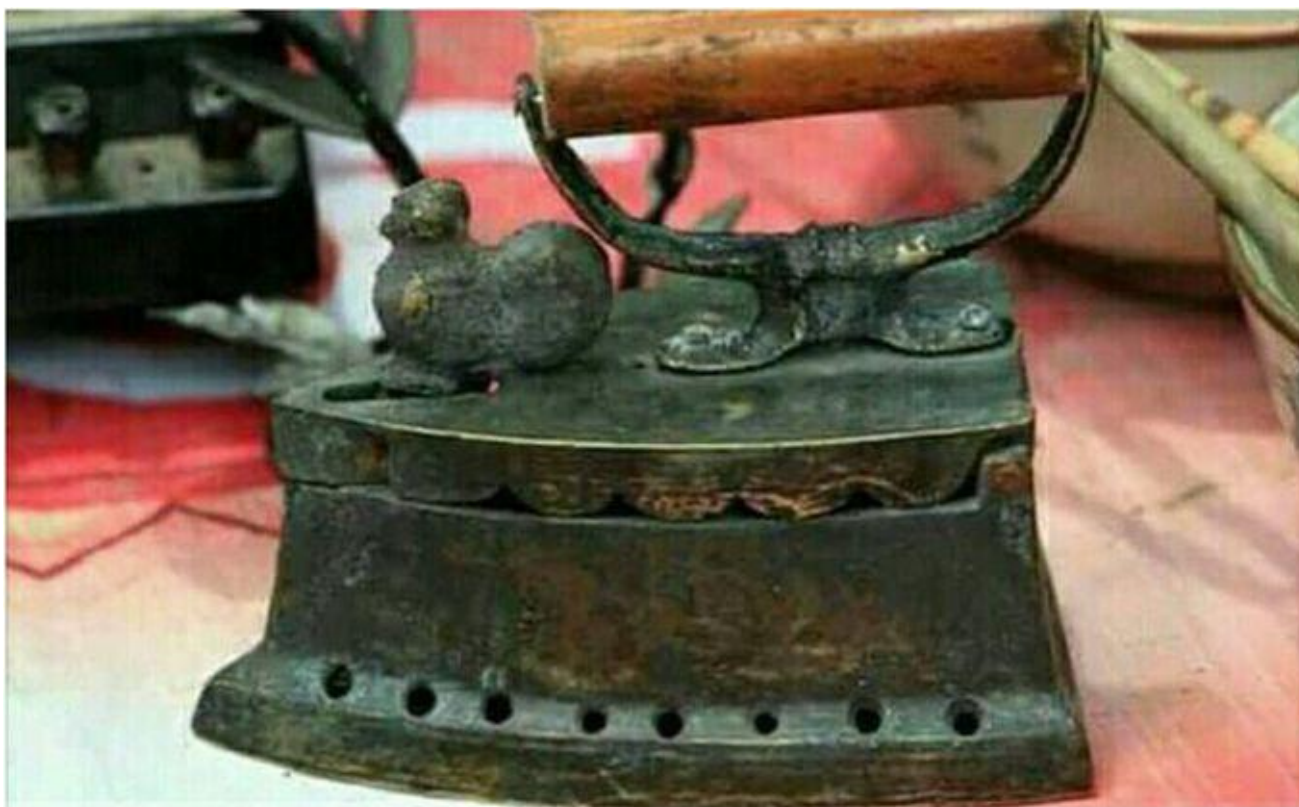
BÀN ỦI THAN CON GÀ THẬP NIÊN 1960