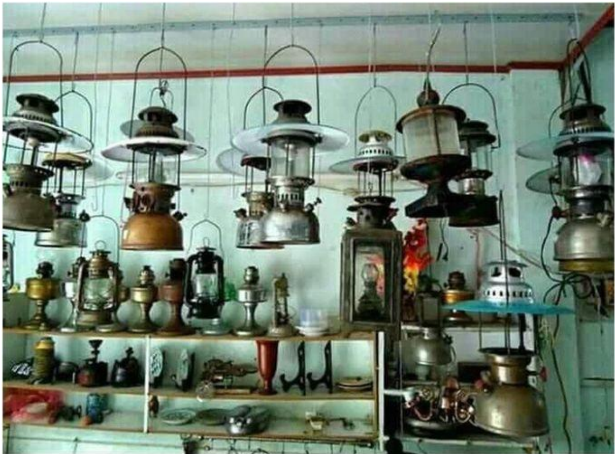
CÁC LOẠI ĐÈN CỦA MỘT THỜI Ở MIỀN NAM VIỆT NAM.