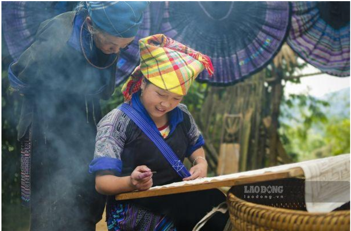
Mù Cang Chải qua ống kính của các nghệ sĩ nhiếp ảnh Yên Bái.