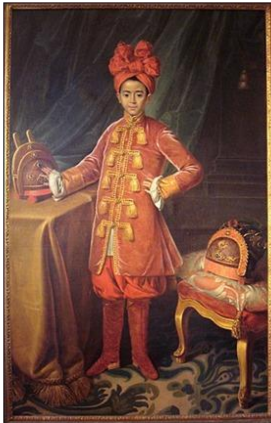
Hoàng tử Cảnh qua nét vẽ của Maupérin (1787)

Càng đi sâu vào tài liệu, tôi càng thấy rõ thâm ý của hai vị học giả và sử gia này: Những điều mà đầu thế kỷ XIX, Bissachère và Sainte-Croix, là hai người Pháp sang Việt Nam đầu tiên viết hồi ký để lại, lấy sự bôi nhọ lịch sử nước Nam làm chuẩn mực. Sách của họ, nếu không được hai nhà nghiên cứu Cadière và Maybon chép lại và tôn thành sự thật lịch sử, thì có lẽ đã rơi vào quên lãng như những cuốn sách tồi tệ khác. Nhưng đến đầu thế kỷ XX, tức là đúng 100 năm sau, những điều họ viết bậy bạ, được hai vị học giả và sử gia có uy tín này trân trọng trích dẫn, làm nền cho những bài viết và sách của họ, khiến những sự bịa đặt của Bissachère và Sainte-Croix trở thành sự thực lịch sử. Và đúng như lời giáo sư Nguyễn Văn Trung: học giả Cadière và tập san Đô Thành Hiếu Cổ (Bulletin des Vieux Amis de Huế) là một kinh viện ngự trị trên nghiên cứu ở Việt Nam từ đầu thế kỷ XX đến ngày nay. Vì vậy, không có gì hữu hiệu hơn, là chính người chỉ huy cơ quan kinh viện này, điều hành việc trình bày "sự thực lịch sử": Nhà Nguyễn là do Pháp dựng nên .