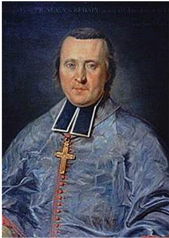
Chân dung Đức Cha Bá Đa Lộc (Pigneau de Béhaine)