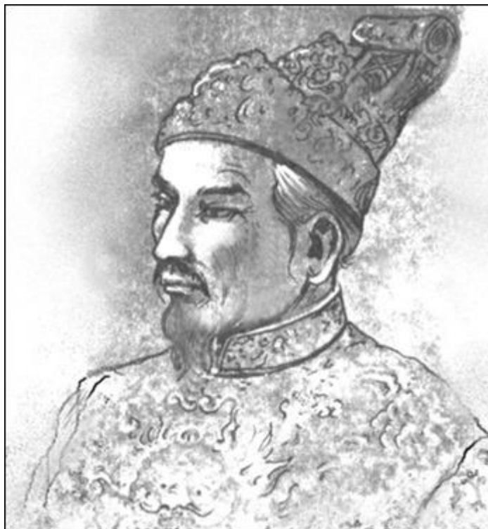
Vua Gia Long

Ánh mắt thương hại của bà cụ, ân nhân đầu tiên trong cuộc đời du học, đã thấm vào tôi, khiến tôi chấp nhận "mặc cảm Đông dương" trong suốt quãng đời tiếp nối, cho đến khi đọc được những lời do chính Bá Đa Lộc viết, năm 2014, in trong tập sách vừa mua. Những lời này đã giải toả trong óc tôi, "tội cố răn căn gà nhà" của vua Gia Long, mà tôi đã bị đầu độc, ngay từ khi ra đời, giúp tôi có đủ bằng chứng, để trở lại con người tự do , không mặc cảm, bởi vì, bây giờ tôi biết rằng triều đại cuối cùng của nước tôi, là một triều đại rục rĩ, đã được xây dựng hoàn toàn trên hai tay của một thiếu niên anh hùng: Nguyễn Ánh.