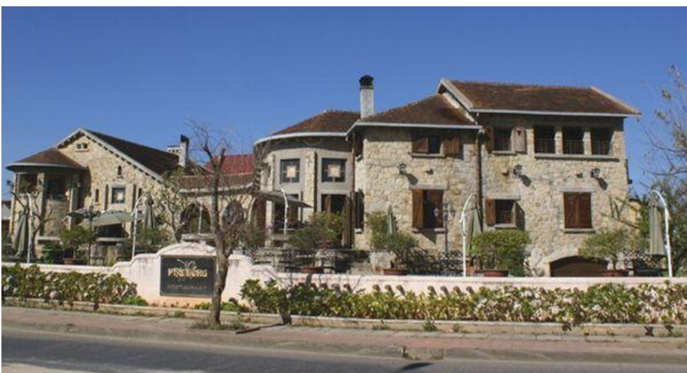
Biệt thự Phi Ánh xây dựng vào năm 1928, mô phỏng kiến trúc vùng Basque, Tây Ban Nha. Năm 1940, Bảo Đại mua lại biệt thự này để tặng cho thứ phi Phi Ánh.