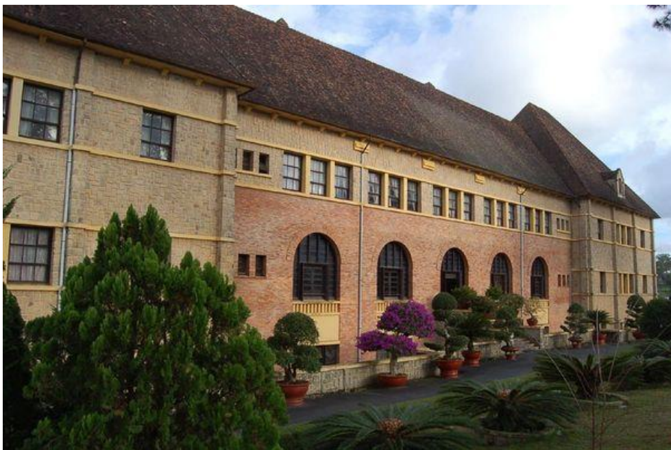
Sở địa dư Đông Dương nay là Xí nghiệp Bản đồ Đà Lạt