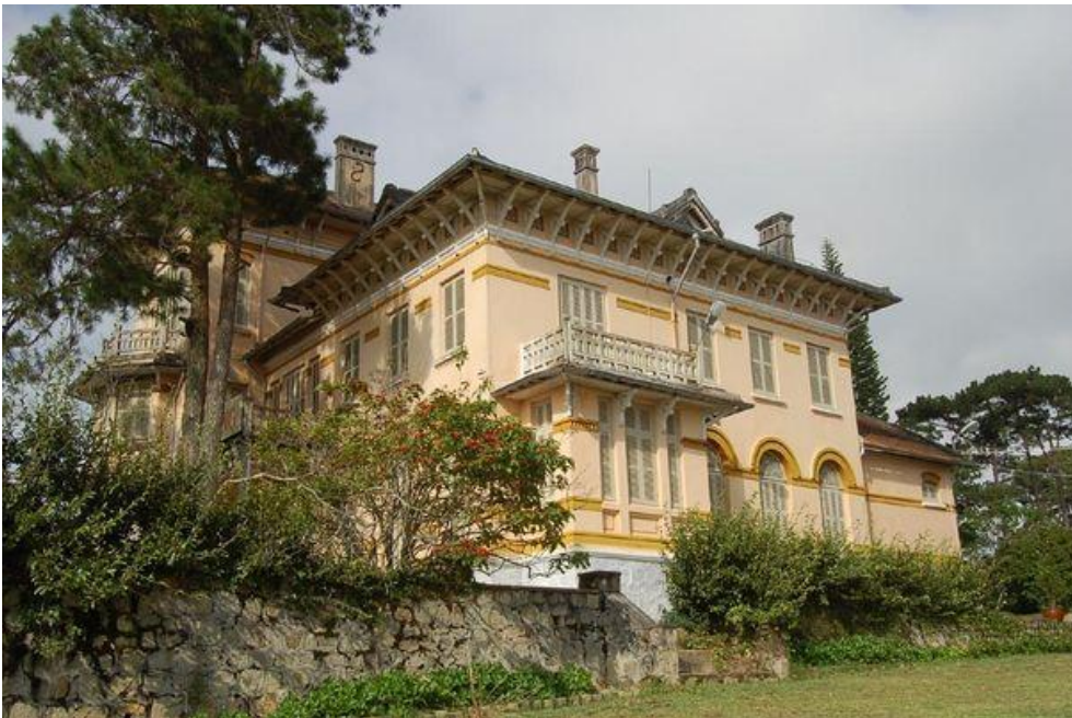
Biệt thự Long Mỹ quận công Nguyễn Hữu Hào (cha mẹ Nam Phương Hoàng hậu)