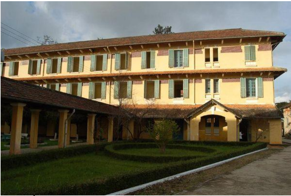
Các khối nhà phòng học bao quanh khuôn viên sân trường được kết nối bằng các dãy nhà hành lang.