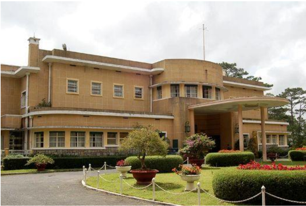
Dinh III: Biệt thự nghỉ hè của Bảo Đại