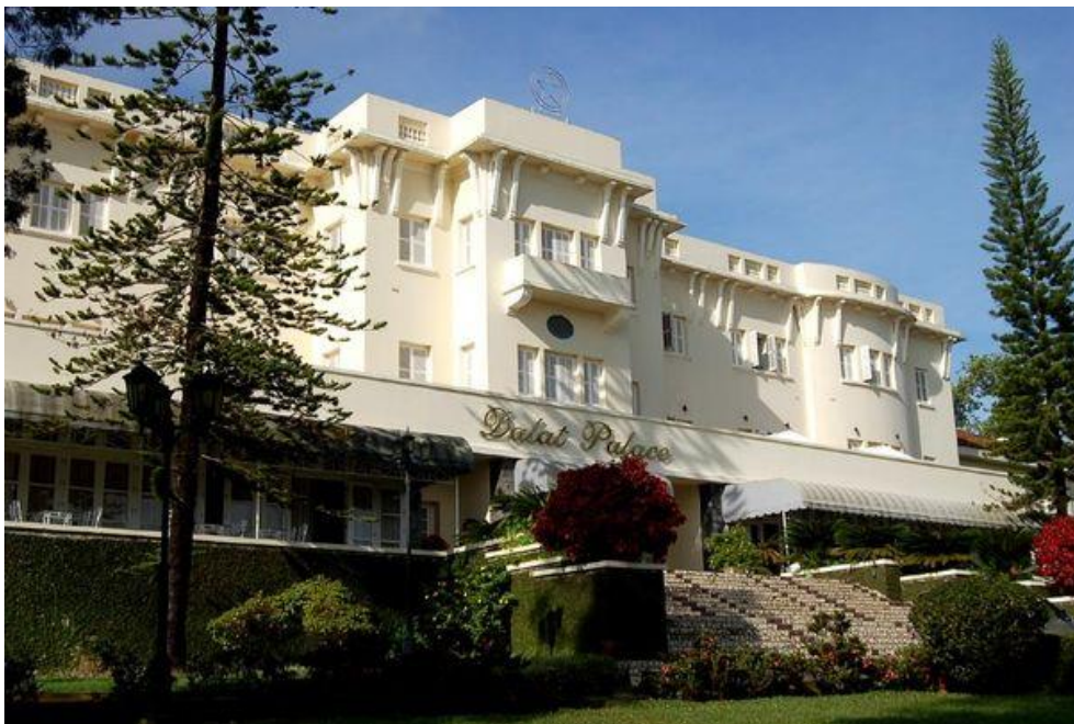
Ngày nay là khách sạn Dalat Palace sau khi có thời đổi thành Sofitel Dalat Palace