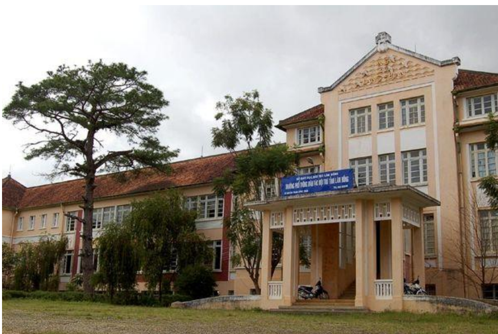
Nay là trường dân tộc nội trú tỉnh Lâm Đồng