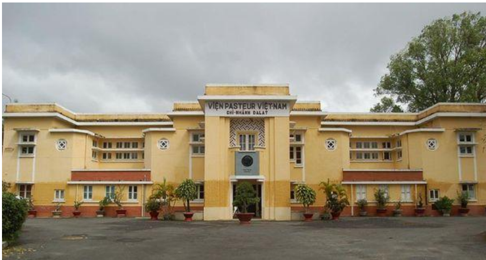
Viện Pasteur xây dựng năm 1935