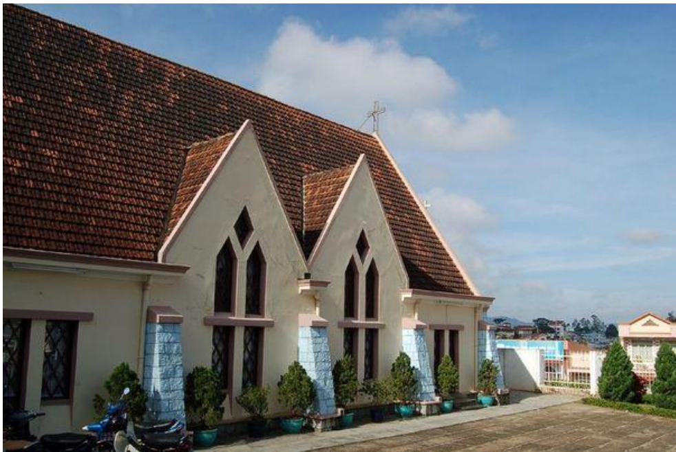
Nhà thờ Tin Lành Đà Lạt