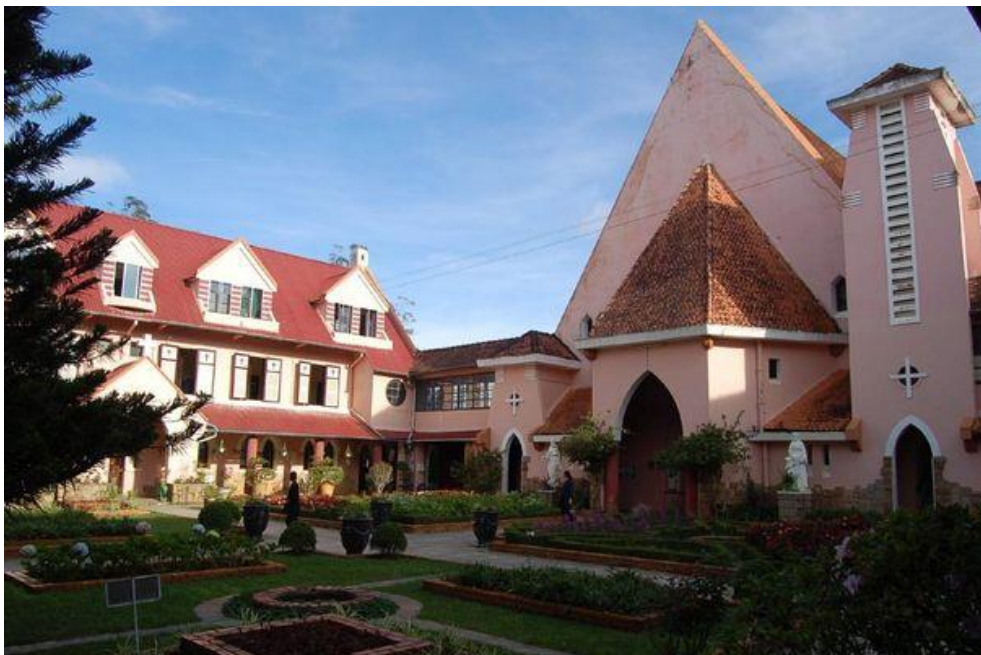
Phía bên trong nhà thờ có một vườn hoa tuyệt đẹp