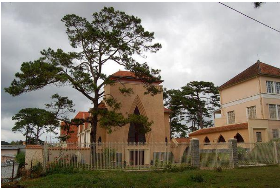
Tu viện Đức Bà Lâm Viên trong khuôn viên trường