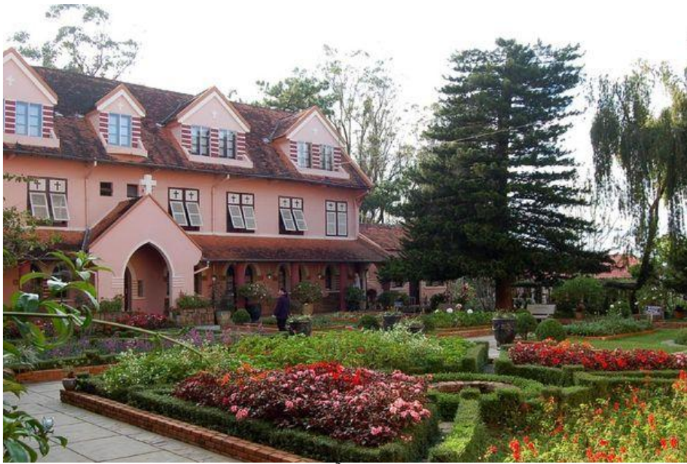
với hai cây tùng trên 75 năm tuổi