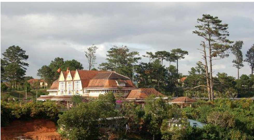
Ga Đà Lạt là ga duy nhất của Việt Nam được công nhận là di tích lịch sử văn hóa quốc gia