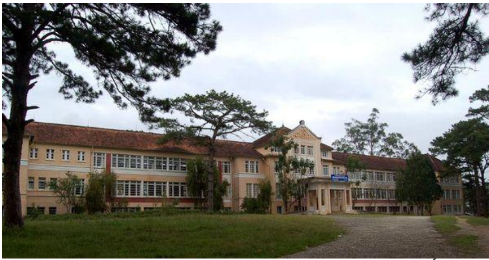
Trường Đức Bà Lâm Viên được xây dựng từ năm 1934 đến 1936