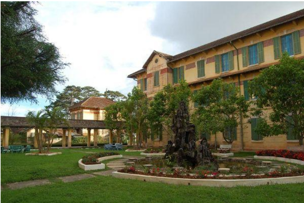
Tháng 6/1936 Grand Lycée hợp nhất cùng Petit Lycée thành trường Grand Lycée Yersin, để ghi nhớ công ơn của BS Yersin.