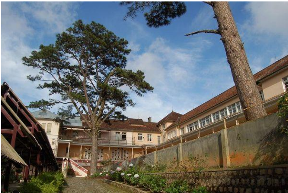
Đây là trường nữ sinh nội trú do các tu sĩ dòng Đức Bà thành lập. Hoàng hậu Nam Phương từng theo học trường này