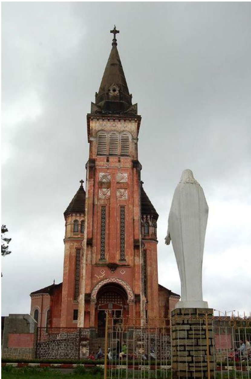
Nhà thờ chánh tòa Đà Lạt thường được gọi là Nhà thờ Con gà vì trên đỉnh tháp chuông có hình con gà lớn biểu tượng cho thánh Phêrô Nhà thờ được khởi công xây dựng từ năm 1931, đến năm 1942 hoàn thành