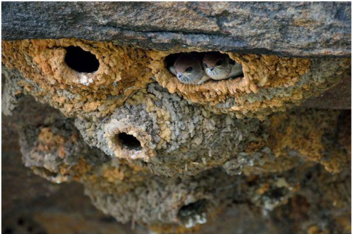
Tổ chim nhạn