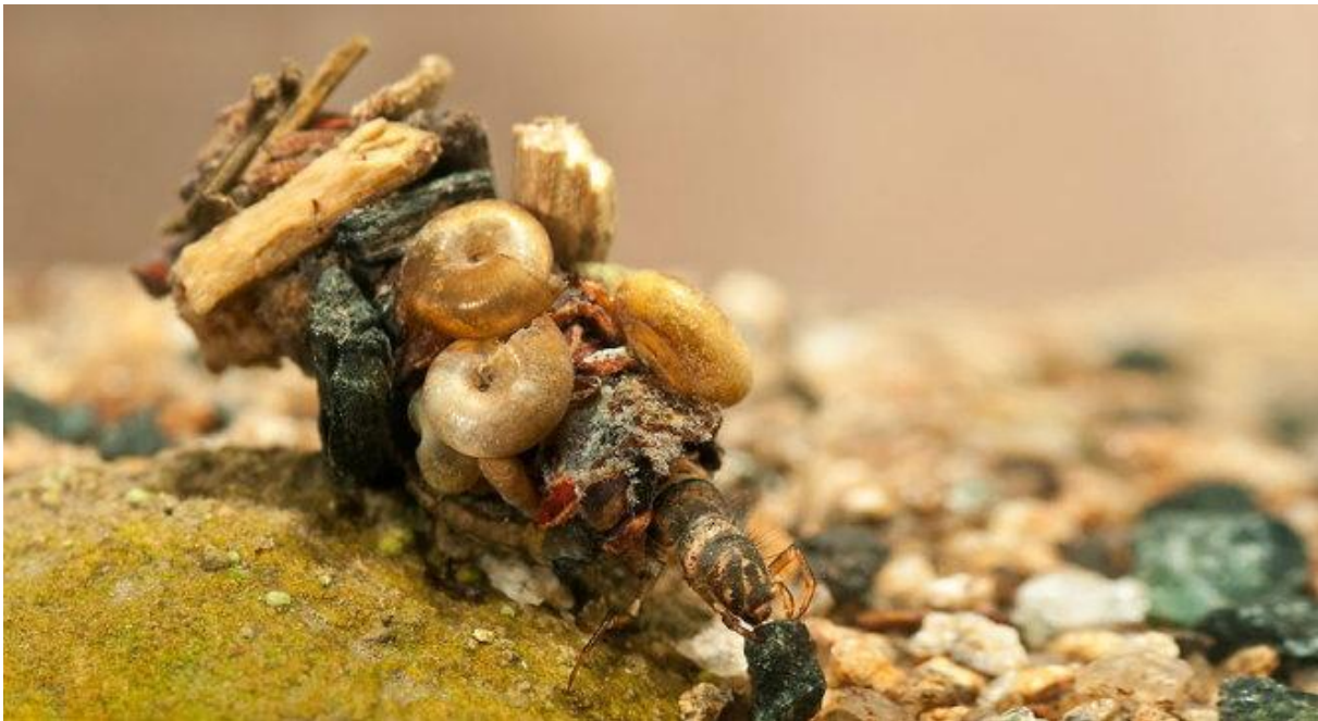
Tổ của sâu bọ cánh lông