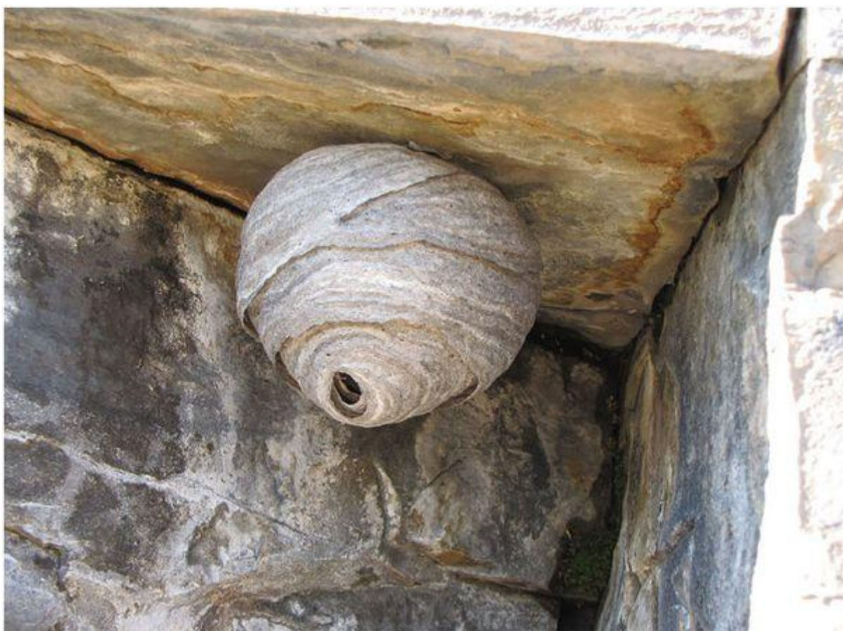
Tổ ong bắp cày