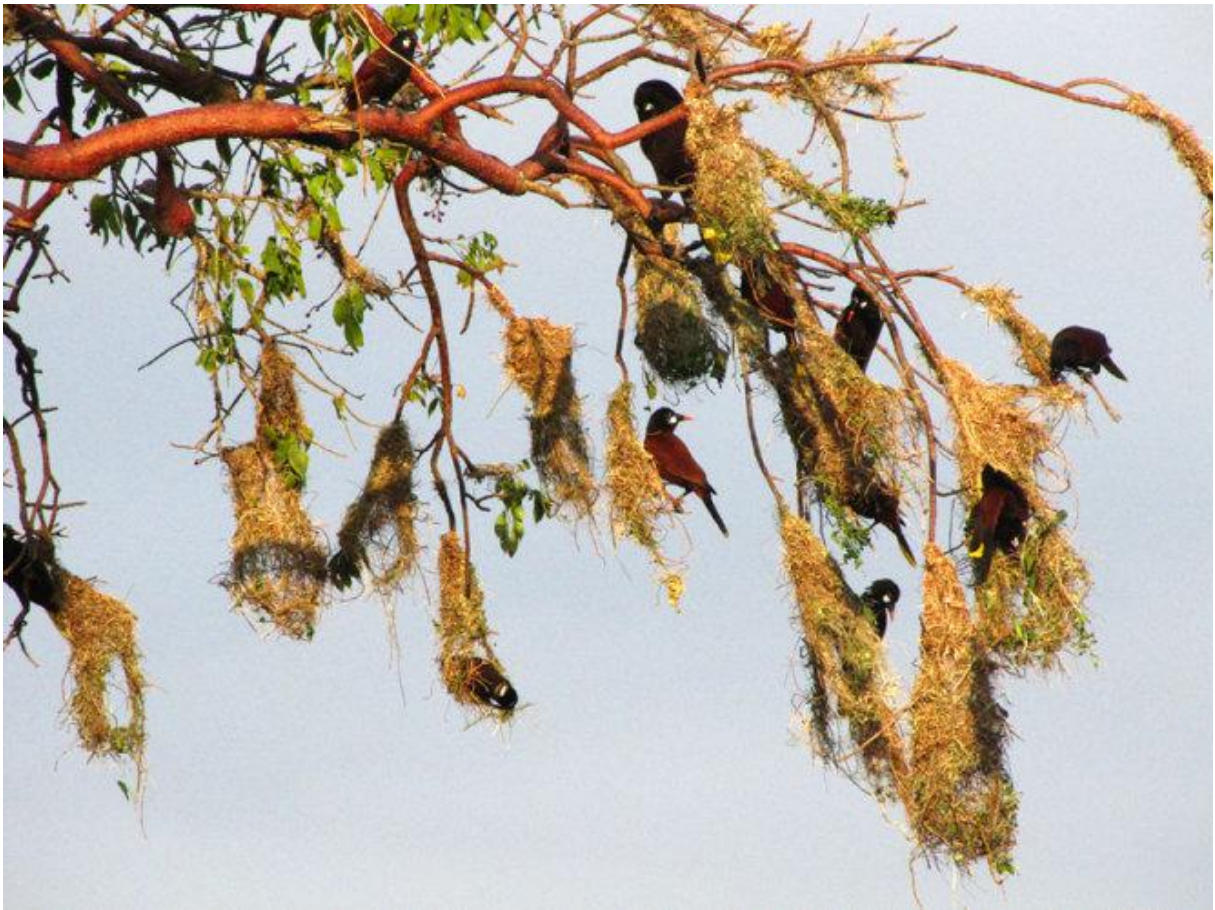
Tổ chim vàng anh Montezuma - trông như những chiếc túi trên cây